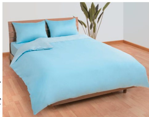
→ ひもなしらくらく掛ふとんカバー (Nグリップ) ブルー ダブルサイズ 3,800円(税別)