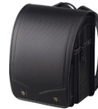
カーボンブラック