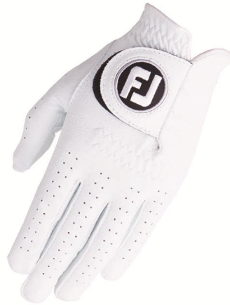
ゴルフ用グローブ フットジョイ「ナノロックネオ」