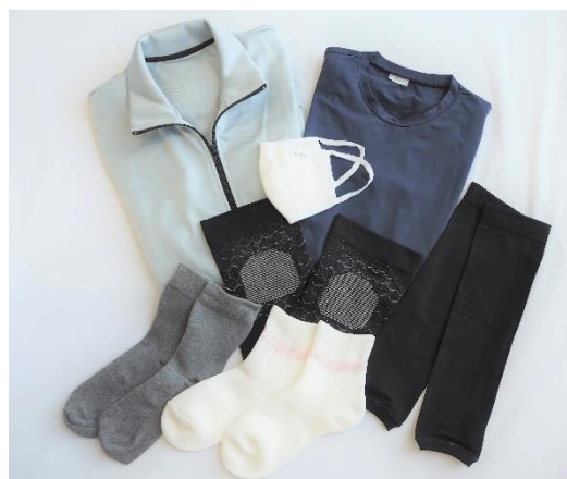
「PIECLEX」使用の繊維商品例