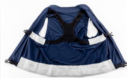
「MATOUS GOLF」のベスト、リストバンドとセンサー