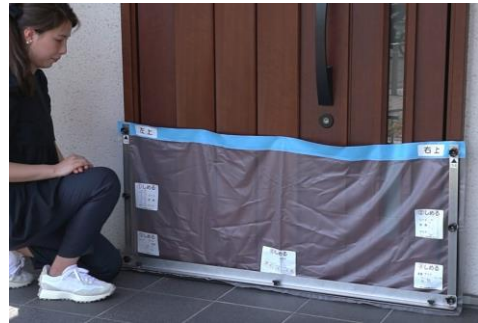
「とめっば」の設置例