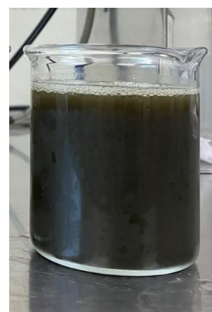
今般開発した技術を用いて茶葉から 抽出・分離濃縮した高たんぱく質溶液