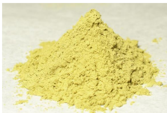
今般開発した技術を用いて茶葉から 抽出・分離濃縮した茶葉繊維