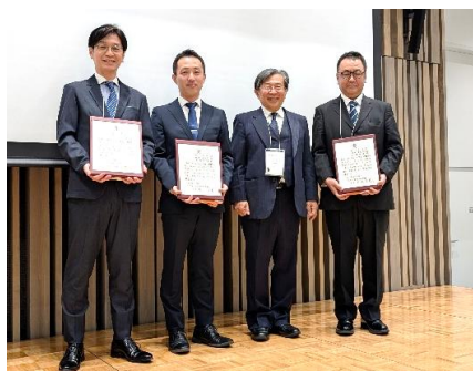
授賞式の様子（25 年 11 月開催）

心・血管修復パッチ「シンフォリウム」は、先天性心疾患の手術で使用される医療機器です。吸収性の糸と非吸収性の糸で編んだ特殊な構造のニットに、吸収性の架橋ゼラチン膜を一体化させています。手術によって心臓や血管に縫着された後、まず架橋ゼラチン膜が、次に吸収性の糸が徐々に分解され、その間に非吸収性の糸を含むように自己の組織が形成されます。これにより、先天性心疾患の外科手術後に生じる材料の劣化や、成長に伴うサイズのミスマッチといった課題の解決が期待されています。