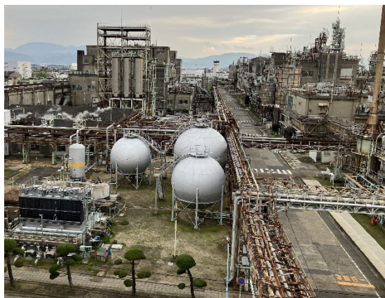
松山事業所の外観