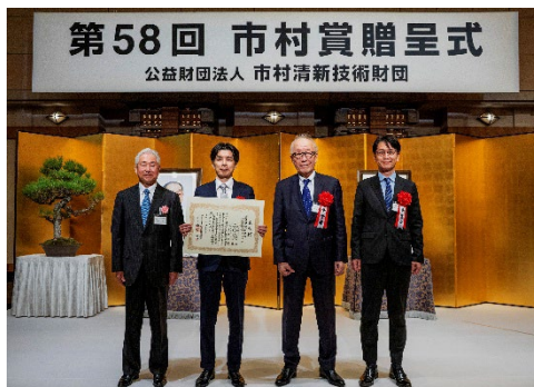
2026年4月17日に開催された贈呈式の様子

今回の受賞テーマは「小児心臓手術における再手術のリスクを減らす心・血管修復パッチ」であり、心・血管修復パッチ「シンフォリウム」の開発に携わった帝人株式会社、福井経編興業株式会社、大阪医科薬科大学の3機関が受賞しました。3機関は、先天性心疾患患者における再手術のリスクを低減し、患者および家族の心的負担の軽減やQOL向上に貢献する心・血管修復パッチ「シンフォリウム」を産学官連携により開発したことが評価されました。また、社会的な必要性が高い一方で患者数が少なくかつ高度な設計技術が求められるために開発への参入が限られている小児用医療機器分野において、今回の3機関の取り組みが子供を救う治療技術革新の先導的な事業化モデルとなる点も評価されました。